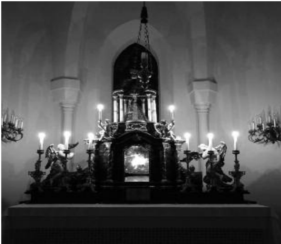
Suzie Léger, {Uterus = Space = Universe}, 2007, Ausstellungsansicht, INNEN raum, Mariazeller Kapelle, Dornbacher Pfarrkirche, 2015.

Rezension zur Ausstellung INNEN raum: Erkundungen der Leiblichkeit im sakralen Raum (20. Februar - 7. April 2015), Dornbacher Pfarrkirche